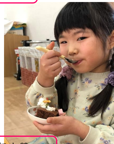
おいしそうなケーキができたよ♡

アトラクションは異年齢ペアできょうりょくしながら自分たちが持っている半分のハートにあうハートを園内で探すゲーム♡