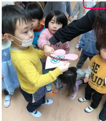
おんなじハートみつけた!!!