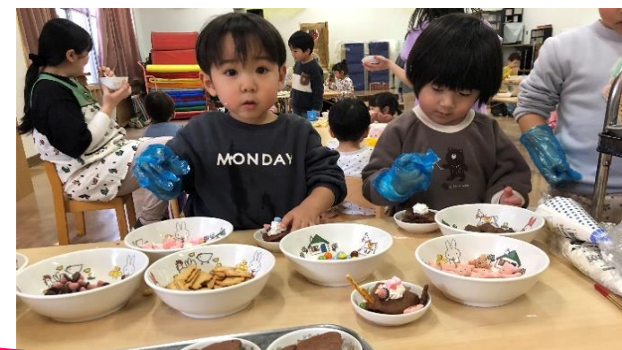
どれをトッピングしようかな♪