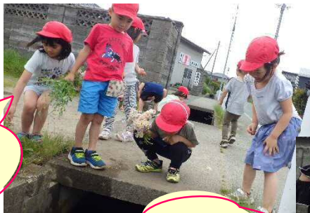
ね～見て見て 流っていったよ～

用水路の蓋の下を流すとどうなるか試し始めました。花や草を用水路に入れた後、時間差で反対側から流れて出てくる様子にわくわくしていた子ども達。その楽しさを知ると何度も試したくなるものです。何度も流し、皆で出てくる花や草を見て大笑いしていました。