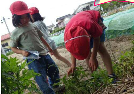
こっちは じゃがいもかな

畑の野菜に水を掛けていると、畑以外の場所にイチゴとジャガイモの苗を発見！葉っぱの形で何の苗か分かるようになってきている子ども達に驚きです。そっちの苗にも水を掛けてあげ、「大きくなるといいね～」と生長を楽しみにしていました。