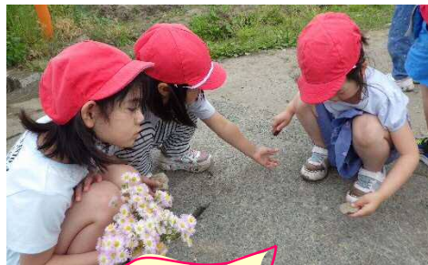
こっちの石は どうなるかな

畑で拾った石で絵がかけられることを発見！もう一つの石でかくと、色が違うことにも気付きました。その後は他の石も拾ってきて、「これはどうかな」「こっちもしてみよう」と友達と試行錯誤して自分達の発見を楽しんでいました。