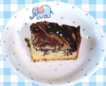
9/6(金)マーブルケーキ