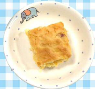
9/18(水)にんじんホットケーキ