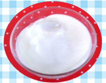
9/2(月)フルーツヨーグurt