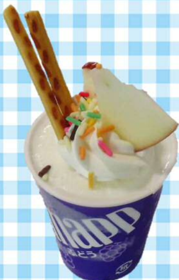
9/26(木)りんごのパフェ