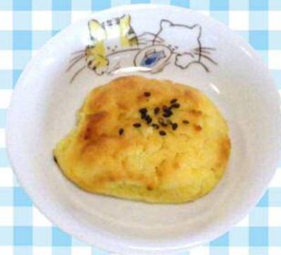
9/25(水)スイートポテト