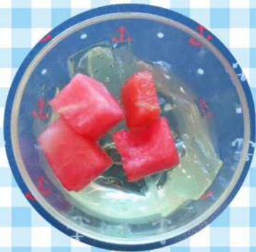
9/3(水)スイカのゼリー