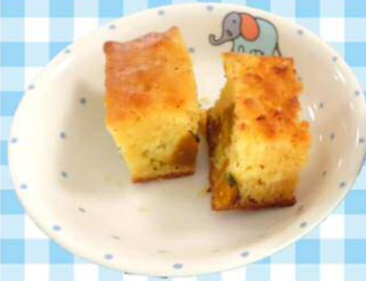
9/5(木)かぼちゃマフィン