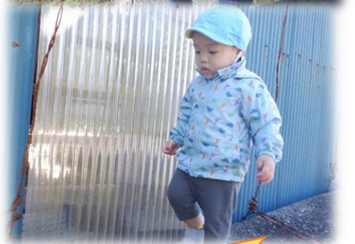
高い所もへっちゃら！

秋晴れの日には、散歩車に乗ってお出かけしています。木の枝やススキやトンボ、黄色や赤に色づいた葉っぱなどたくさんの秋を発見！実際に手に取って触ってみると、不思議な感触にじーっと眺めたり、秋の自然に触れる中で、驚きを感じたりと季節の変化を全身で感じ取っています。