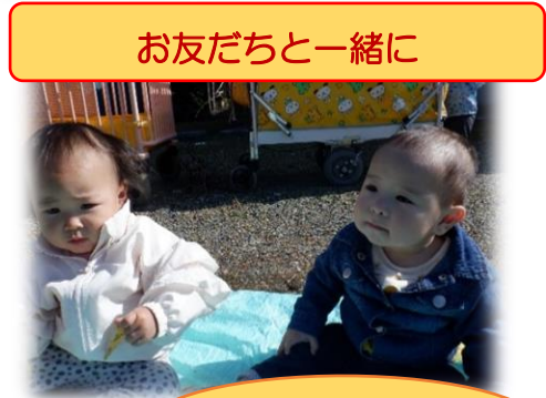
お友だちと一緒に