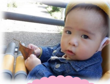
ねえねえ みつけたよ！