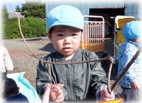
いっぱいあったよ！