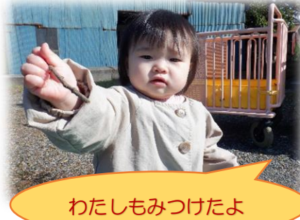
わたしもみつけたよ