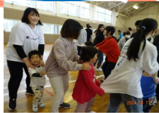
じゃんけん列車 もりあがりました!!

あいにく🌧️のお天気でしたが、 体育館で色々な遊びに挑戦! 「ジャンボリーミッキー」のダンスや じゃんけん列車ゲームも盛り上がり ました(*^-^*) お弁当もおいしかったね♪